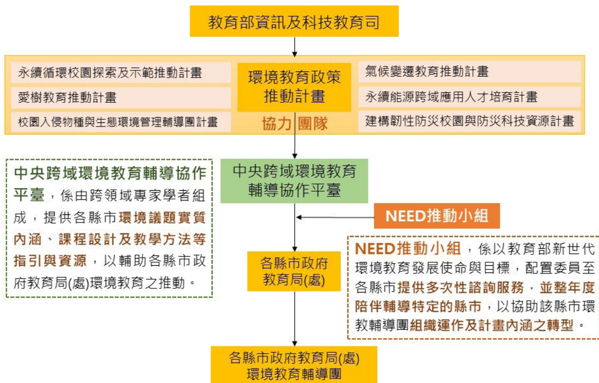
圖 2 本部資訊及科技教育司環境教育相關議題跨計畫資源整合示意圖