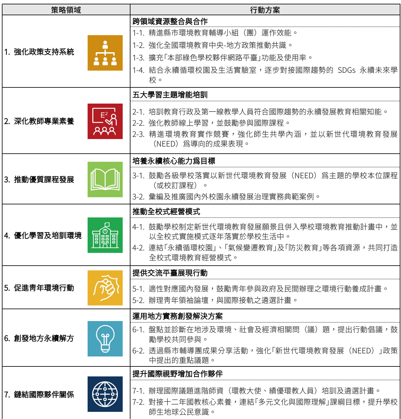
表 1、策略領域與行動方案對應表

本四年中長程計畫之定位，為本部推行「新世代環境教育發展 (NEED)」政策之行政配套措施，作為民國 111~114 年之策略規劃 (Strategic Planning)。為能有效落實政策願景與目標，因此訂定 7 項策略領域 (包括政策支持、教師專業、優質課程、學習環境、青年行動、地方永續及國際夥伴)，並且研擬了 17 項相對應的行動方案 (表 1)，以及 28 項執行事項 (表 2)。